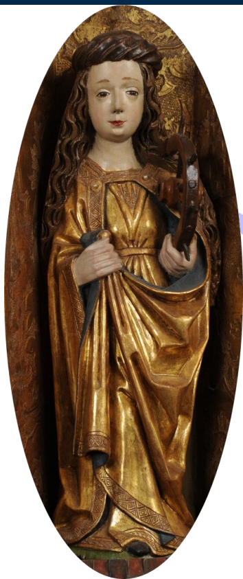
Alexandriai Szent Katalin szobra a Felkai Mária-oltárról 1480

Alexandriai Szent Katalin születésének pontos ideje nem ismert, az viszont biztos, hogy 305-ben Alexandriában halt vértanúhalált. .