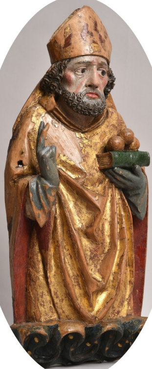
Szent Miklós Magyar szobrász 1490 körül

Szent Miklós a keresztény egyházak egyik legnépszerűbb, leghíresebb szentje. Életéről több legenda is mesél. Ezek szerint 270 körül született Patraszban, és 343 körül halt meg.