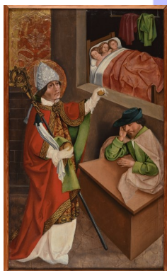
Két jelenet Szent Miklós életéből Magyar festő 1480-90 között

ATTRIBÚTUMAI: püspöki ornátus, evangéliumos könyv rajta három arany, fehér szakáll (bizáncias típus), hajó